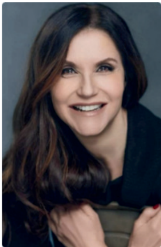
Alessandra Martines Ambassadrice du Pèlerinage